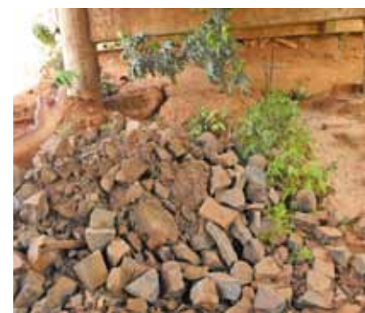
Coluna da ponte, afetada pela a infiltração de água