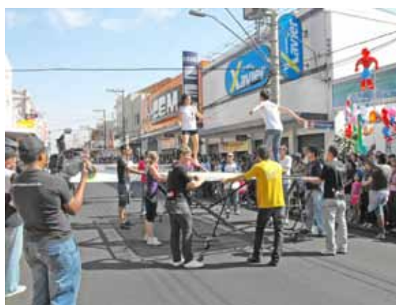
Jovens saltam em cama elástica