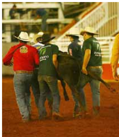
Peões transportam bezerro que fraturou a coluna na prova de Bulldog em barretos, que teve que ser sacrificado.

Mas caso os políticos jaboticabaleses, fiquem omissos e continuem concordando que os animais sejam torturados em rodeios, resta a população pressioná-los, ou então, também se cale diante dessa aberração, e aguarde pacientemente enquanto os animais padecem, que o o Congresso Nacional com seus mais de 300 picaretas, como disse o ex-presidente Lula, aprove o projeto de lei de Ricardo Tripoli.