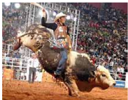
Alegria de uns e sofrimento de outros, protejam nossos animais, acabem com os rodeios

Em uma decisão digna de aplausos, e um exemplo a ser seguido, a Câmara Municipal de Araraquara - SP, em 05/09, aprovou projeto de lei de autoria do prefeito Marcelo Barbieri (PMDB), proibindo a realização de Rodeios, Touradas, Vaquejadas ou outro tipo de evento que exponham os animais a violência.