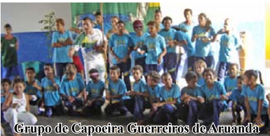
Grupo de Capoeira Guerreiros de Aruanda