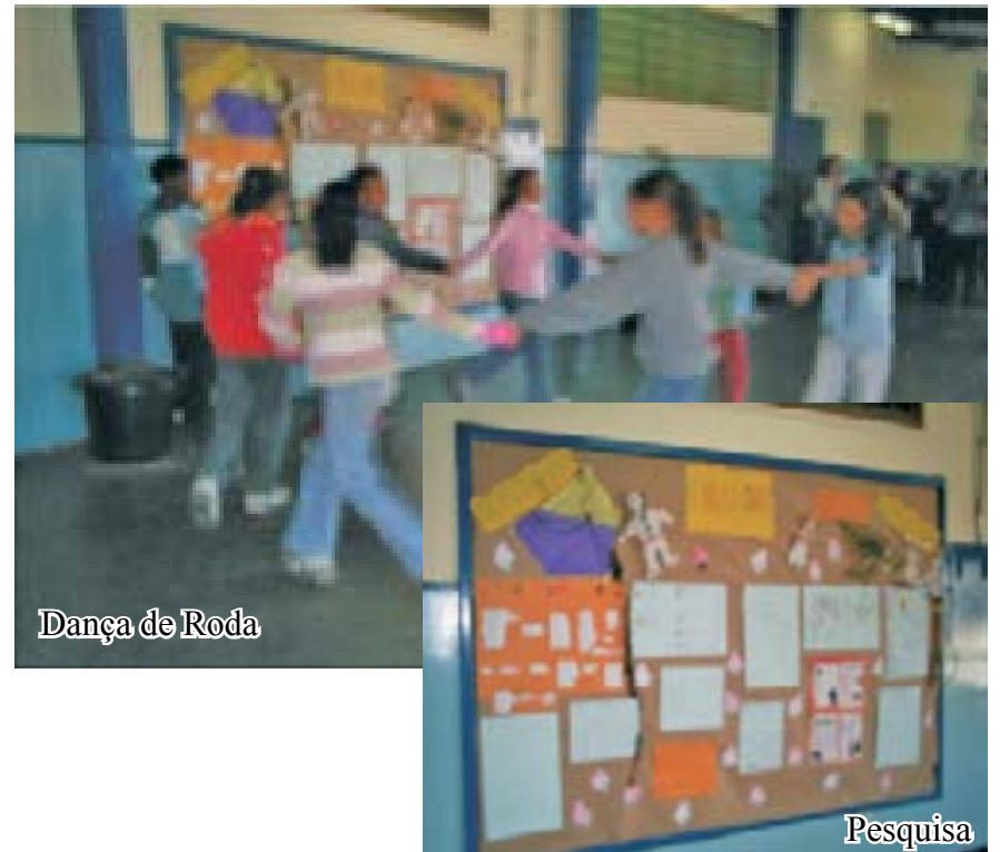
Dança de Roda

Registro de algumas atividades desenvolvidas na escola: