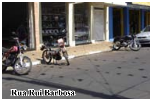
Rua Rui Barbosa