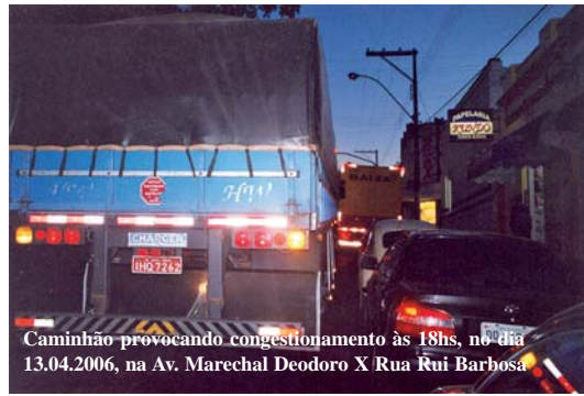
Caminhão provocando congestionamento às 18hs, no dia 13.04.2006, na Av. Marechal Deodoro X Rua Rui Barbosa

Para uma cidade do pequeno porte de Jaboticabal, a bagunça generalizada e a impunidade parecem ser obra de algum cientista maluco tentando estudar a “Teoria do Caos” aplicada ao trânsito. Todos desrespeitam abertamente as leis de trânsito, inclusive a própria Prefeitura. Além dos munícipes que estacionam impunemente em frente a guias rebaixadas e esquinas, a inexistência de placas indicativas na cidade chega às raias do absurdo: as ruas principais do bairro da Nova Jaboticabal não têm placas indicativas de direção, assim como várias ruas do centro, como a Juca Quito, Tiradentes e outras, e os exemplos mais gritantes são as ruas circundantes ao