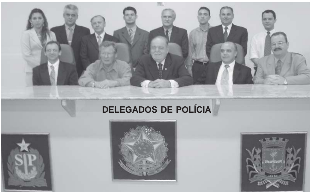
DELEGADOS DE POLÍCIA