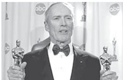
Menina de Ouro “nocauteou” os concorrentes nas seguintes categorias: filme, diretor, atriz e ator coadjuvante.

Há quem diga que não existem mais inovações e surpresas na grande festa da sétima arte, o Oscar. Na maioria das vezes, os prêmios são premeditados e os discursos de agradecimento não trazem emoções, independente do ganhador. As