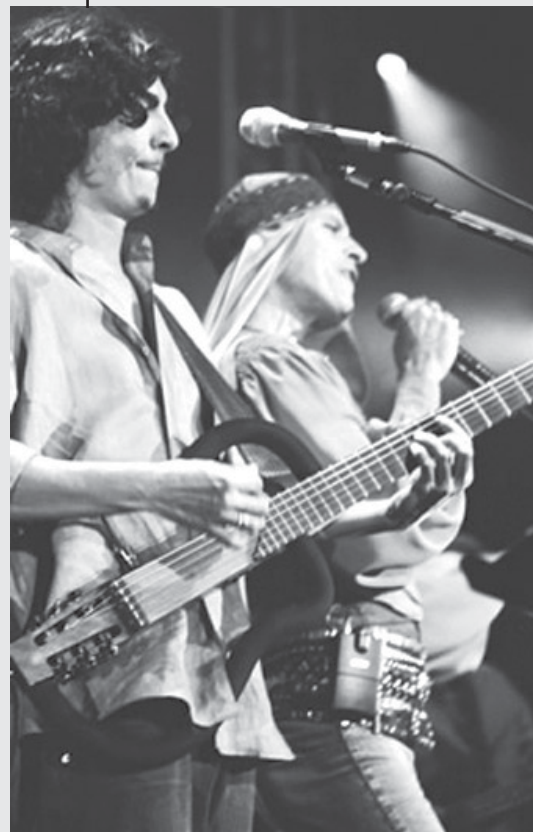
Ney Matogrosso e Pedro Luís na estréia do espetáculo Canecão - Rio de Janeiro.

O show "Vagabundo" com Ney Matogrosso e Pedro Luís e a Parede será apresentado no dia 8 de março as 21 horas no estacionamento do RibeirãoShopping com entrada franca.