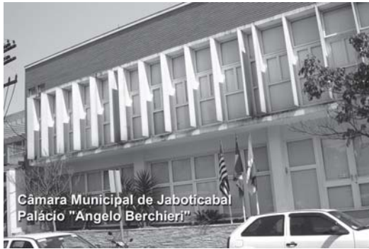
Câmara Municipal de Jaboticabal Palácio "Angelo Berchielli"