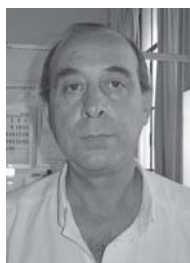
Dr. Gilberto Araújo