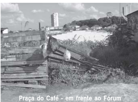
Praça do Café - em frente ao Fórum

casas abandonadas causam para a vizinhança. Infelizmente não temos visto nenhuma atitude por parte da Prefeitura de Jaboticabal através da sua fiscalização para resolver essa situação, esses terrenos são criadouros de escorpiões, baratas, ratos, cobras e outros animais. A maioria desses terrenos não têm calçadas nem muros, e quando os têm estão em péssimas condições servindo apenas para