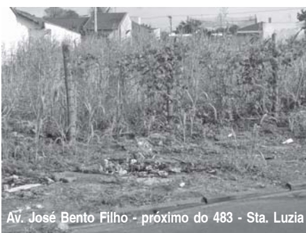
Av. José Bento Filho - próximo do 483 - Sta. Luzia

Não é a primeira vez e provavelmente não será a última que o Jornal FONTE vem mostrando para as Autoridades Municipais e a população em geral, os transtornos que terrenos baldios e