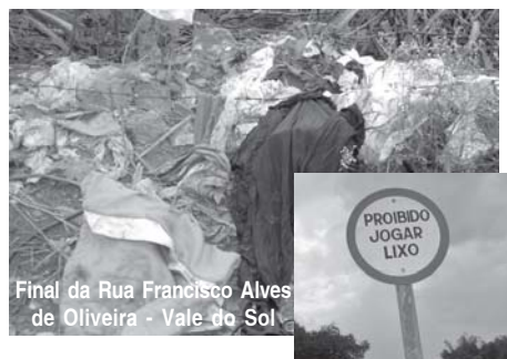
Final da Rua Francisco Alves de Oliveira - Vale do Sol

casas abandonadas causam para a vizinhança. Infelizmente não temos visto nenhuma atitude por parte da Prefeitura de Jaboticabal através da sua fiscalização para resolver essa situação, esses terrenos são criadouros de escorpiões, baratas, ratos, cobras e outros animais. A maioria desses terrenos não têm calçadas nem muros, e quando os têm estão em péssimas condições servindo apenas para